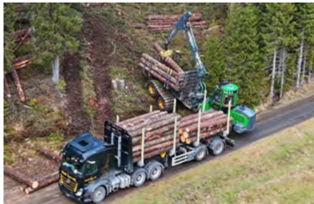
Direktverlad auf LKW mit Forwarder

Parallel dazu wurden mehrere Seilkranschläge gemeinsam mit den zwei einheimischen Forstunternehmungen Riebli Forst AG und Abächerli Forstunternehmung AG ausgeführt. Seit sieben Jahren betreibt der Forst Sarnen keine eigene Seilkrananlage mehr, was einen flexiblen Einsatz modernster Technik ermöglicht.