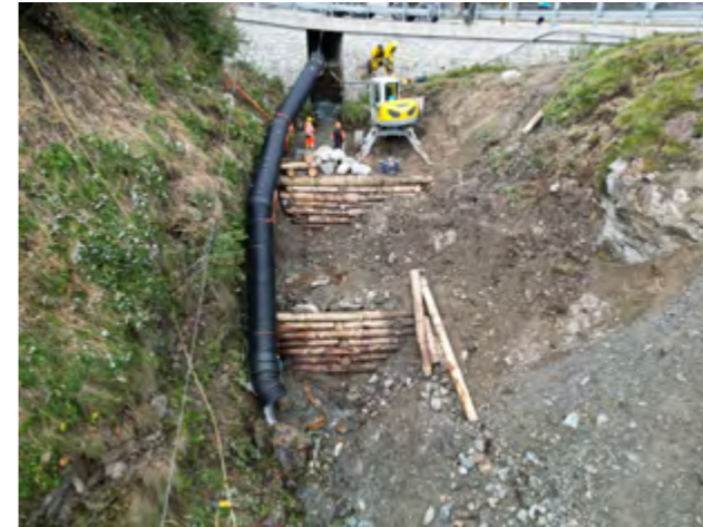
Bachverbauung St. Moritz