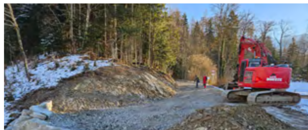
Ausbau Erschliessung Enetriederwald

Diese Arbeiten zeigen die Vielseitigkeit unseres Betriebs in den Bereichen Schutzbauten, Spezialholzerei und ökologische Aufwertung.