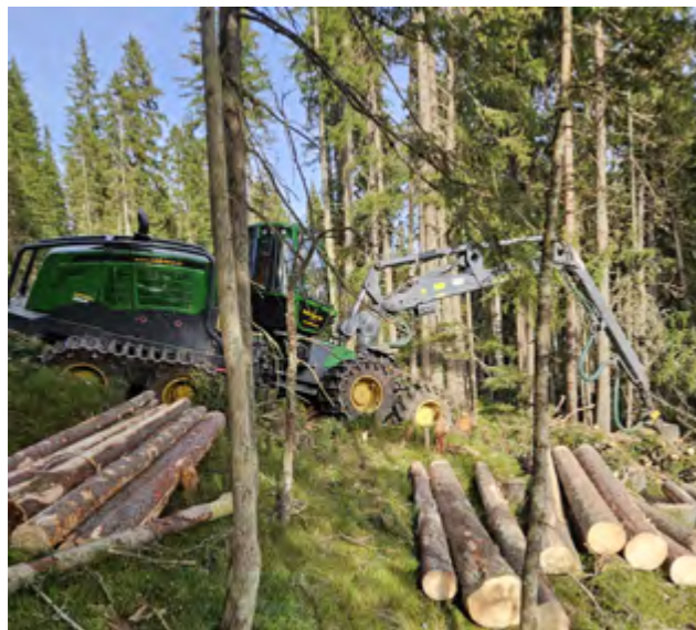
Vollernter im Einsatz