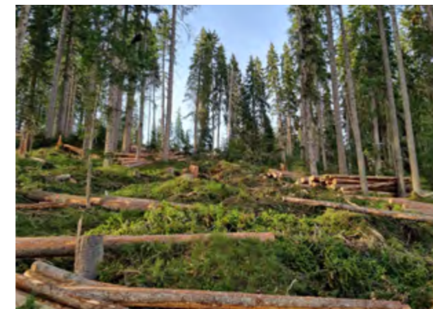
Vollmechanisierter Holzschlag Grabenmettlen-Schlierental

Dank dem grossen Engagement unseres Teams sowie der guten Zusammenarbeit mit den Korporationen, Unternehmern und Auftraggebern konnten wir sämtliche Projekte erfolgreich umsetzen.